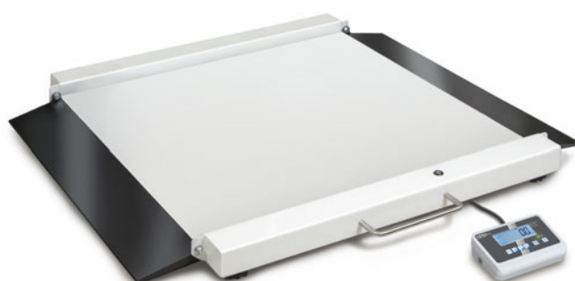
KERN MWA 300K-1M