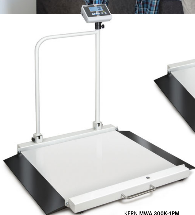
KERN MWA 300K-1PM