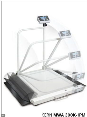
KERN MWA 300K-1PM