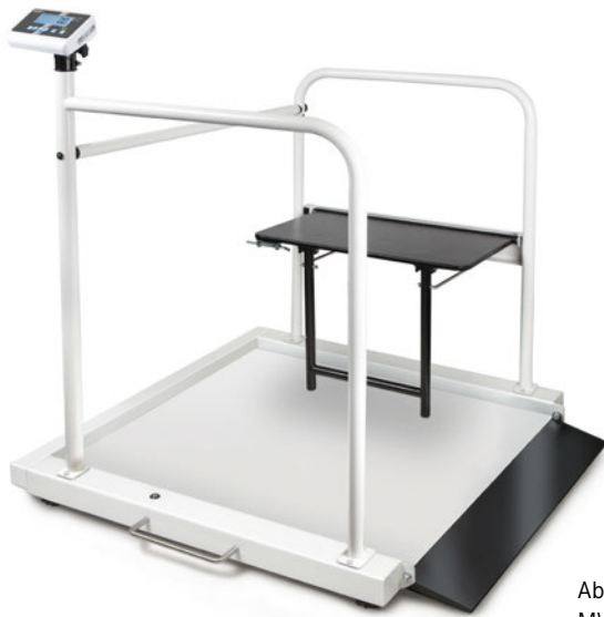
Abb. zeigt MWA 300K-1M + MWA-A04

Rollstuhlwaage mit integrierter Auffahrrampe und Haltebügel-Set mit klappbarem Patientensitz – mit Eich- und Medizinzulassung für den professionellen, stationären Einsatz in der medizinischen Diagnostik