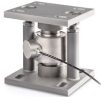
Abb. zeigt optionales Zubehör Montagekit ■ SAUTER CE P41430