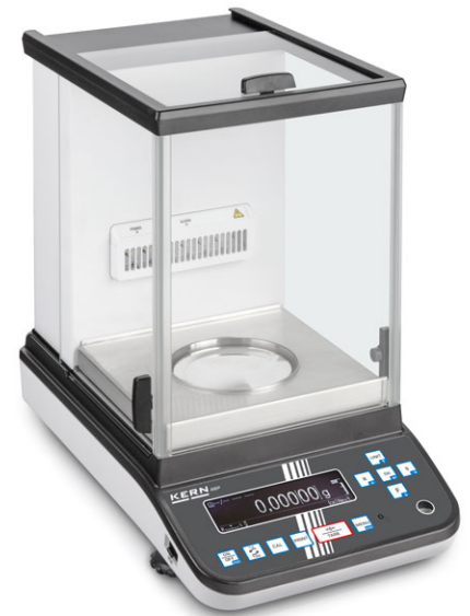
2 KERN ABP 100-5DM mit optionalem Ionisator

1 Extrem schneller Ionisationsvorgang, dank der neuesten Generation der KERN Ionisationstechnologie zum Neutralisieren elektrostatischer Aufladung. Zum Festeinbau in die Analysenwaage. Besonders bequeme Handhabung, da kein separates Gerät mehr nötig ist. Einfach durch Tastendruck das Ionisationsgebläse hinzuschalten. Passend für alle Modelle dieser Serie, siehe Zubehör rechts